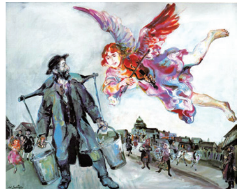
Jeden z obrazów artysty rodem z Cieszyna.

W latach dziewięćdziesiątych rząd francuski zleca mu projekt pomnika poświęconego 50. rocznicy deportacji Żydów francuskich. Odsłonięcie pomnika zaszczycają swoją obecnością Francois Mitterand i Jacques Chirac.