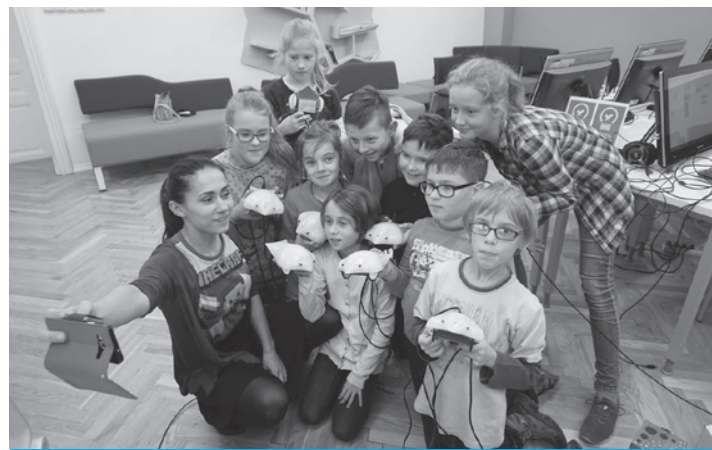
Zabawa z robotami to sama przyjemność.