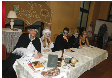
Czytanie to rozrywka intelektualna i zabawa.