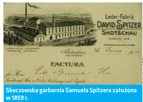
Skoczowska garbarnia Samuela Spitzera założona w 1859 r.