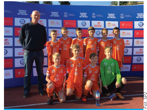
Młodzi piłkarze z SP2 w Cieszynie.

4 października w Chorzowie rozpoczęły się finały i w pierwszym meczu wygraliśmy 3:1. Następny mecz był dla nas bardzo ważny, ponieważ wygrywając go, zapewnilibyśmy sobie awans do półfinału. Niestety pierwsza połowa należała do drużyny przeciwnej, która wyszła na prowadzenie