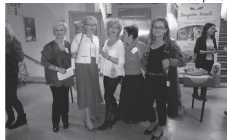
Kobiety kreatywne w działaniu...