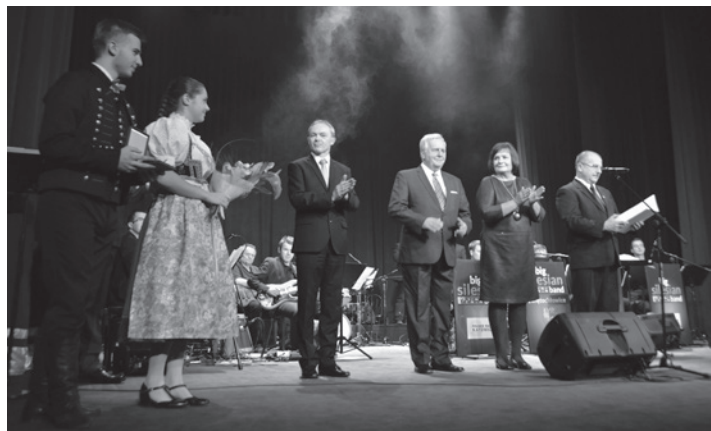
Nagrody zostały wręczone w cieszyńskim teatrze im. Adama Mickiewicza