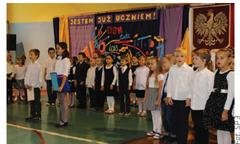
Akademia była wyjątkowo uroczysta.

i przedstawiciele Rady Rodziców pasowali dzieci ogromnym ołówkiem i rozdawali rogi obfitości. Słodkości było tak wiele, że nie jeden pierwszak miał trudności z ich uniesieniem. Tym miłym gestem zakończyła się część oficjalna, a uczniowie ze swoimi paniami powędrowali do klas. Pierwszaki na pewno na długo zapamiętają ten dzień!