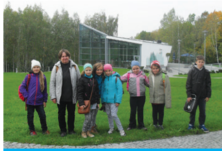
Uczestnicy wycieczki przed pijalnią wód.

Po raz kolejny w SP nr 1 w Cieszynie odbyła się wycieczka z kółka przyrodniczo-turystycznego. Tym razem, 10 października,