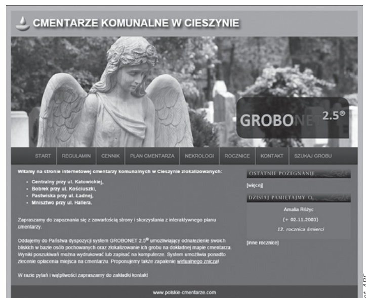
Tak wygląda strona główna cieszynskiego Grobonetu.